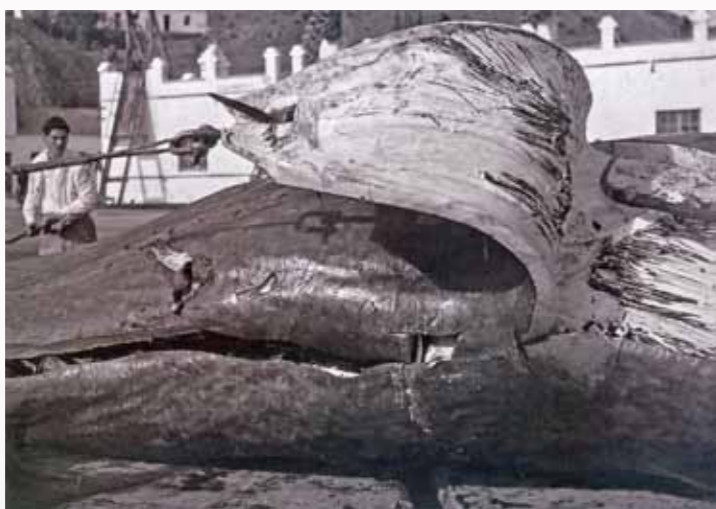
Labor de despiece de un cetáceo

Entre los años 1921 y 1960, una factoría dedicada al despiece y aprovechamiento de la carne y