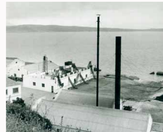
La Ballenera en el año 1964, una vez clausurada la caza y el procesamiento de cetáceos.