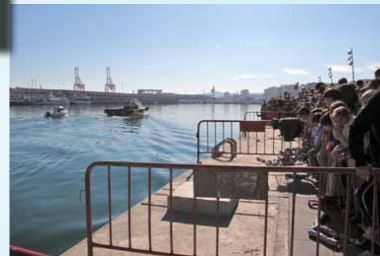
Sus Majestades los Reyes Magos desembarcaron en el Paseo de Ribera del Llano Amarillo para recibir a los miles de niños que les llamaron a través del tradicional arrastre de latas. Ya por la tarde entregaron regalos a los hijos de los empleados de la APBA en el salón del Club Social