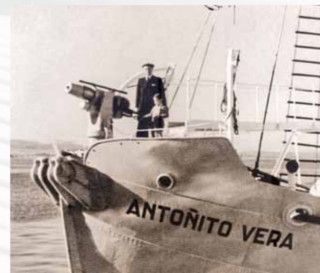
El "Antoñito Vera" en aguas de la Bahía.