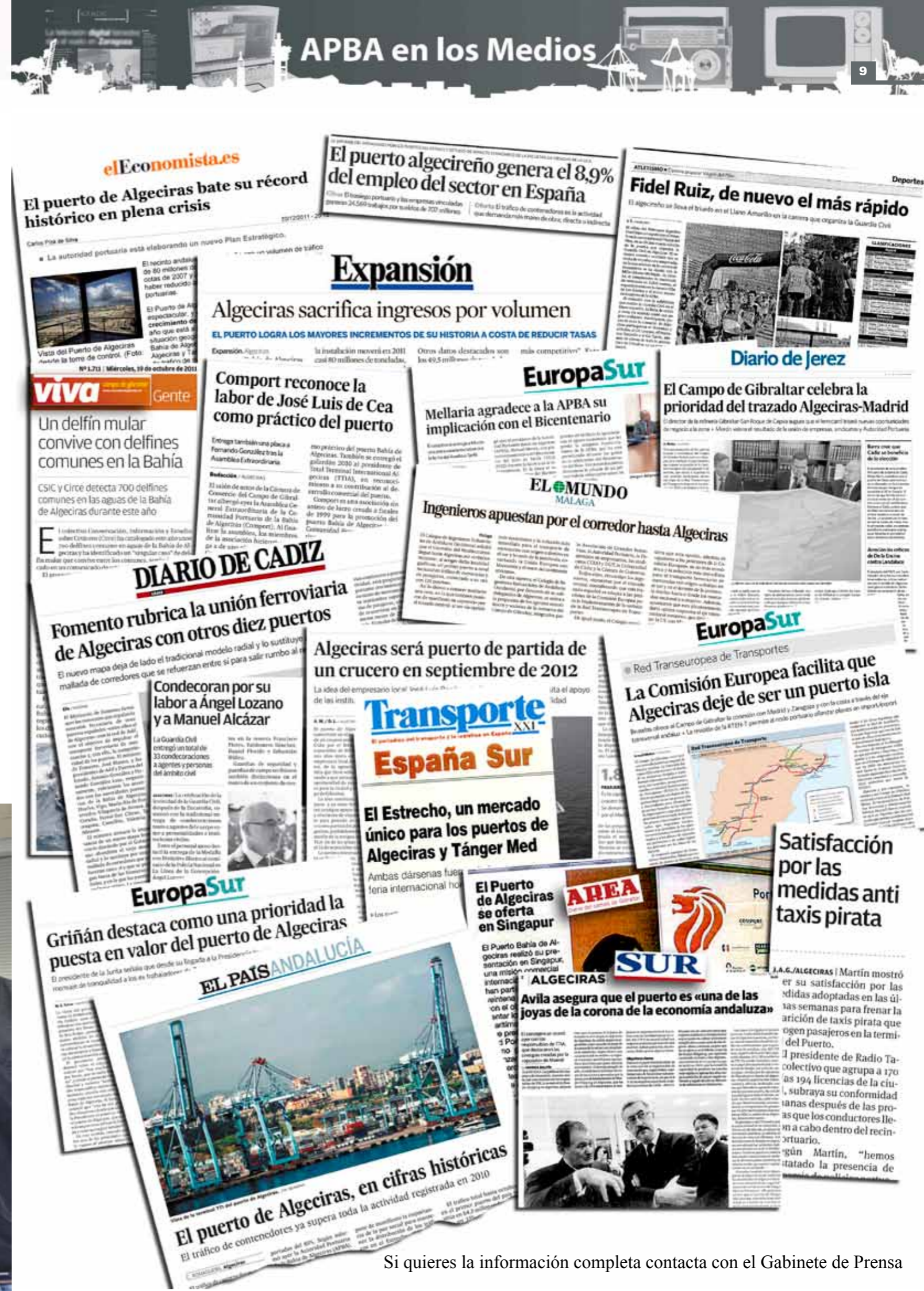
Si quieres la información completa contacta con el Gabinete de Prensa