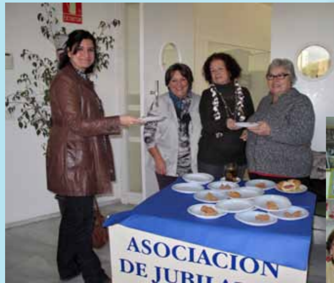
Un año más los trabajadores jubilados de la APBA expusieron las manualidades realizadas a lo largo del pasado año y repartieron 5 kilos de pestiños entre los compañeros para festejar la Navidad