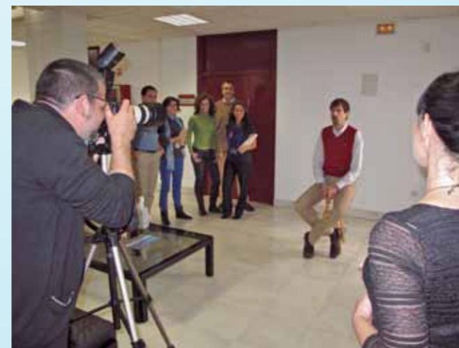
La segunda planta del edificio de Dirección se convirtió en un improvisado "photocall" para participar en la original felicitación navideña de este año