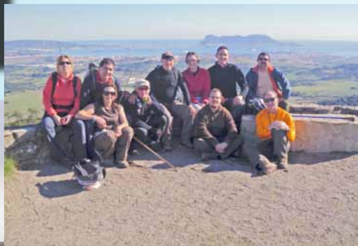
El Club de Senderismo El Macuto sigue organizando rutas por los senderos de nuestra comarca. En las imágenes posan en Las Corzas y en Cerro del Tambor