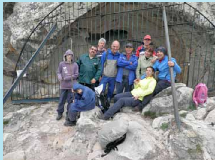
El Club de Senderismo El Macuto no descansa y sigue recorriendo los rincones más recónditos de nuestra comarca. Desde primeros de año ya han realizado rutas por el Monte de la Torre, Sierra Luna y La Laja Alta en Jimena