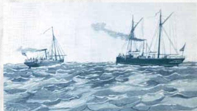
OPERACIONES MILITARES EN EL RÍO.—LA LANCHA DE GUERRA «TARIFA» Y EL CAÑONERO «CUBRYO».

Dentro de lo que es la historia marítima de la Bahía de Algeciras, si consultamos los Estados Generales de los Buques de la Armada, hay embarcaciones guardacostas que, unas veces las encontraremos con el nombre de "lanchas cañoneras" y otras como "cañoneros" e incluso hay algún sitio donde se pueden ver reflejadas como "escampavías".