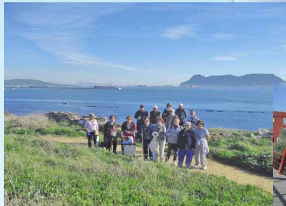
De la mano de El Macuto , los miembros de la Asociación de Jubilados de la APBA también están realizando rutas senderistas por la zona. En las imágenes posan en el parque fluvial del Río Pícaro y el Parque del Centenario