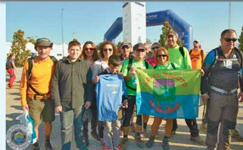
Durante los últimos meses los compañeros del Club de Senderismo El Macuto han realizado diversas rutas dentro y fuera de nuestra comarca (senda de los Prisioneros-Puerto de la Higuera-Las Corzas-Río de la Miel, Bujeo-Llanos del Juncal-Tajo de las Escobas, valle del Jerte en Cáceres...) También han recorrido los 31 kilómetros de la I Travesía Ciudad de Málaga.