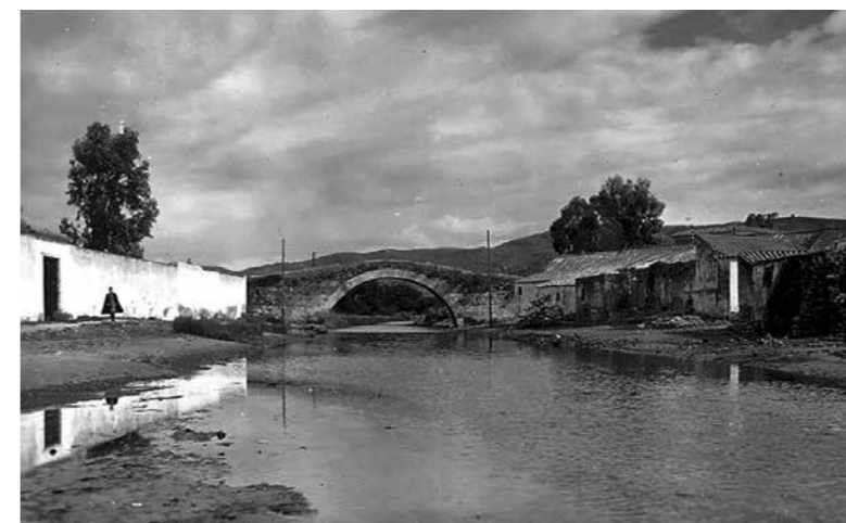
Vista de Puente Mayorga en 1932

La prensa sanroqueña se había mostrado muy sensible con lo que consideraba una marginación del municipio, falto de las infraestructuras más elementales e ignorado en sus verdaderas potencialidades. En este sentido, el bisemanario local El Correo , publicaba en su edición del 25 de febrero de 1894, un extenso artículo en defensa de los intereses de la localidad y pidiendo el puerto para Puente Mayorga: