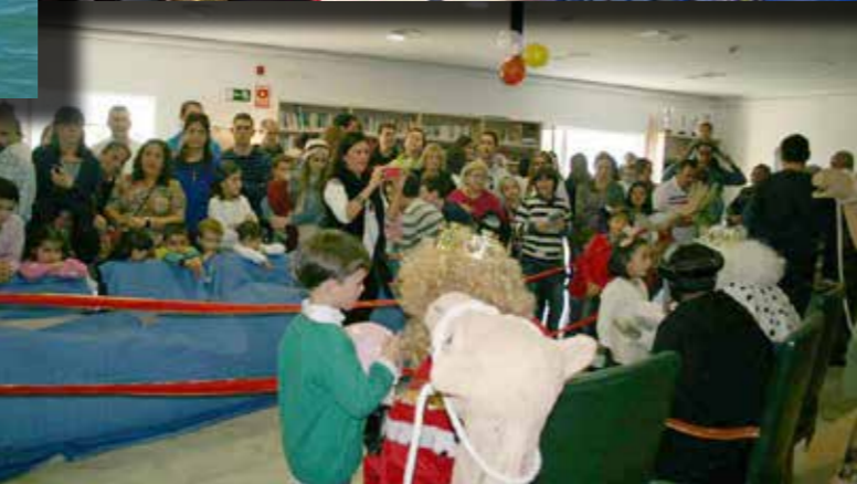
Los más pequeños volvieron a ser los protagonistas en la víspera del 6 de enero. Por la mañana recibieron a los Reyes Magos en el Llano Amarillo y por la tarde los saludaron en el Club Social de los trabajadores.