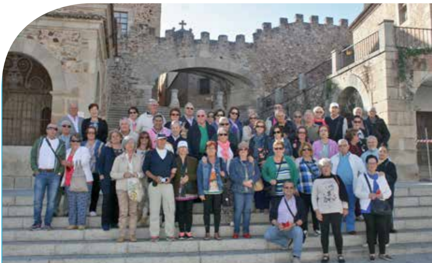
La Asociación de Jubilados y pensionistas de la APBA conmemora este año su XV aniversario y para celebrarlo el pasado mes de mayo realizaron un circuito de seis días por Extremadura y el valle del Jerte