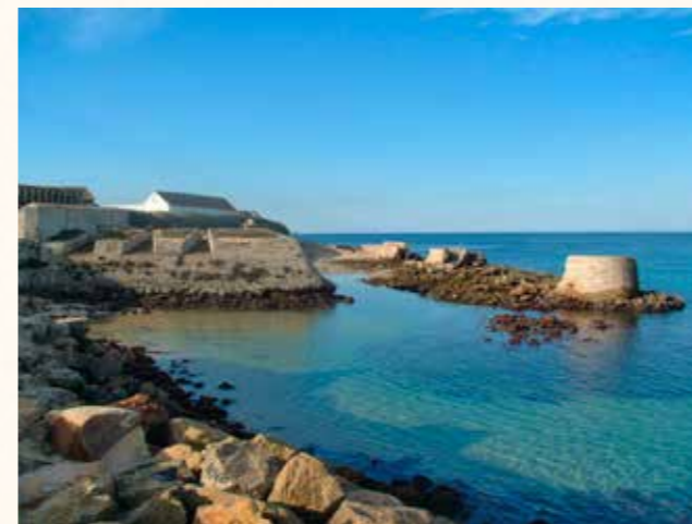
La Darsena de la Isla y la batería del Revellin o rediente de poniente

Desde entonces, numerosos proyectos de fortificación de la isla fueron conformando su estado actual, superponiéndose unos a otros y perfeccionando las defensas artilleras de la isla con nuevos almacenes o cuarteles subterráneos, aljibes, baterías acasama-