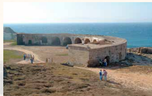
La batería acasamatada de Poniente o batería de Daoiz y Velarde 1858-1861

La isla de Tarifa constituye una verdadera fortaleza, cargada de historia y que concentra en su interior construcciones de muy diversa antigüedad, desde posibles hipogeos fenicio-púnicos en el acantilado del frente de tierra hasta un completo catálogo de baterías y fortines repartidos en su perímetro, así como numerosos almacenes y cuarteles, ejemplos de cómo